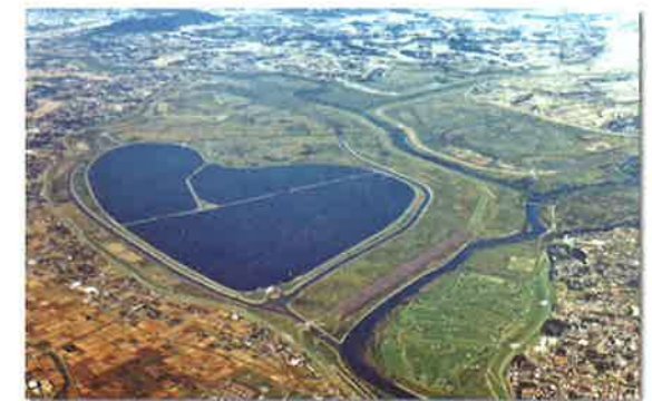
日本一大きなハートの谷中湖(渡良瀬遊水地)