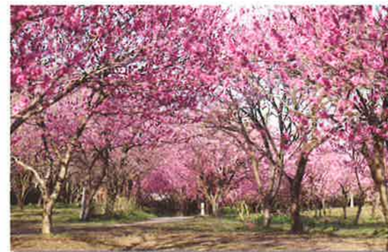
1,500本のはなももが咲き乱れる古河桃まつり(古河公方公園)